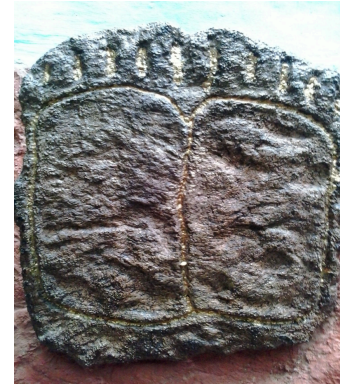
Tomás Doreste Caballero