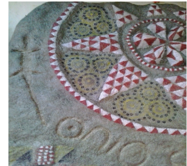
Tomás Doreste Caballero

CASA DE LA CULTURA - GUÍA DE GRAN CANARIA